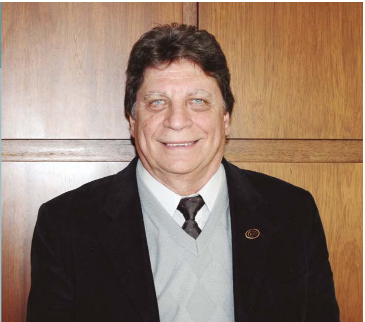
Presidente do CNB/RS, Ney Paulo Silveira de Azambuja fala sobre as medidas de combate ao coronavírus nas serventias extrajudiciais durante entrevista à Rádio Bandeirantes

Entrevista foi concedida ao jornalista Gerson Anzzulin em 27 de abril