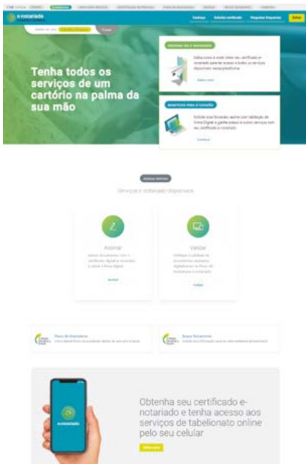
Plataforma unifica todos os processos necessários para a realização dos atos online